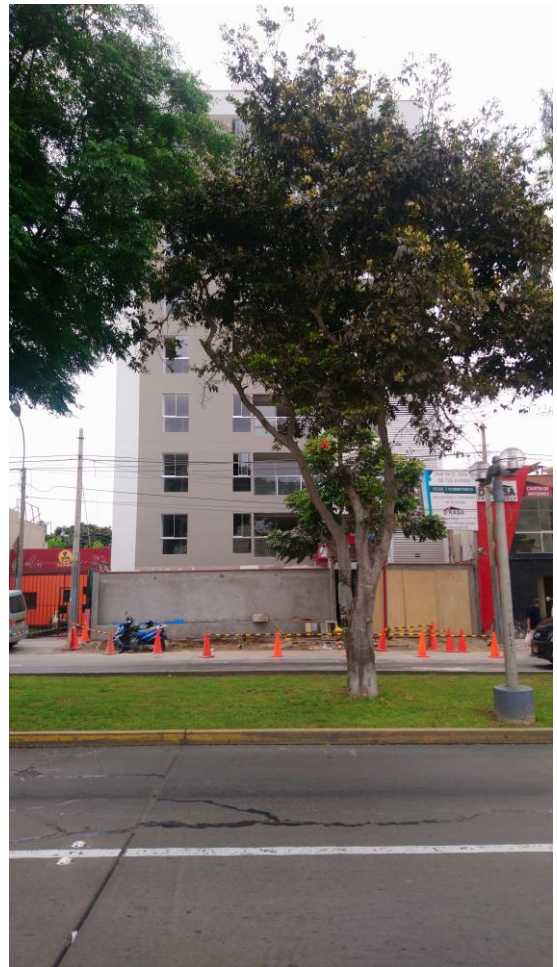
EDIFICIO AL FRENTE DEL TERRENO DE 10 PISOS, CON 3.00M DE RETIRO