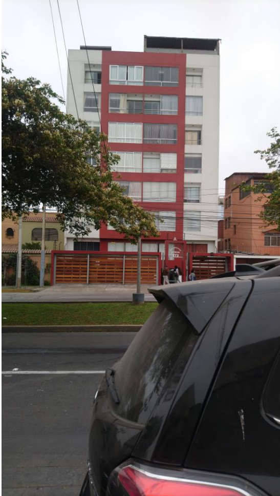
EDIFICIO AL LADO DE TERRENO DE 07 PISOS Y SEMISOTANO, CON 3.00m DE RETIRO